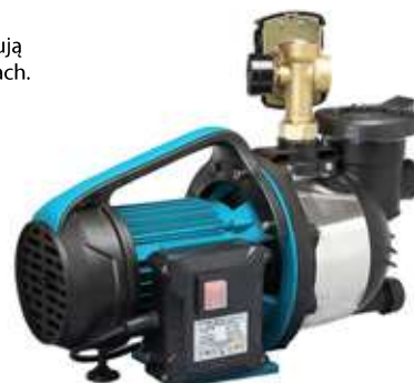
MULTI 1300 INOX