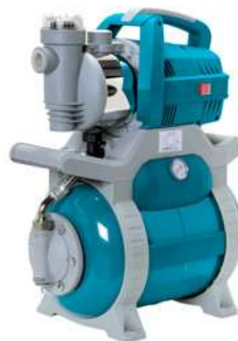
MULTI GARDEN KOMPLETNY ZESTAW HYDROFOROWY